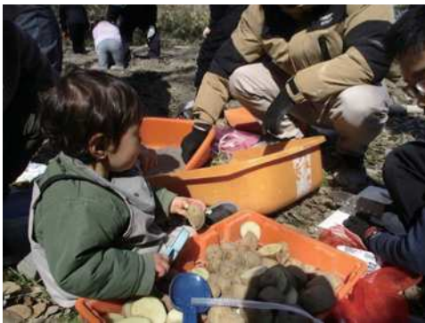
種芋を半分に切り灰をつけて植える準備を行う

今年度、最後のイベント「第5回 ファミリーメイト イモっ子冬」がたくさん参加者とともに、行われました。土に触れる感触を楽しみながら、子供達は、ジャガイモの種芋を植えてくれました。数ヶ月後には、収穫をして、掘り立てのジャガイモを、頂く予定です。成長の様子は、順次お知らせします。午後からは、毎回好評の手作りのバウムクーヘンを作りました。(左下の写真)