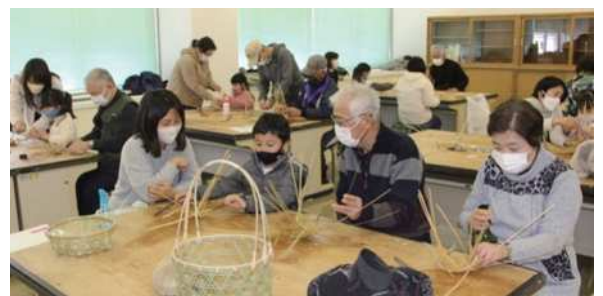
小学1年生から大人まで緊張しながらも楽しそうです