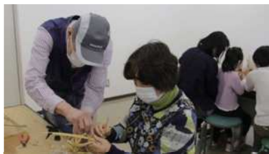
間違っていないか、メンバーがチェック