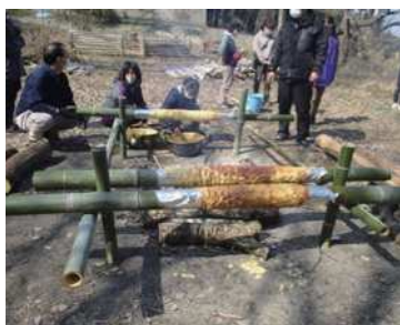
竹に生地を幾重にも塗り層を厚くしながら作っていくバウムクーヘン