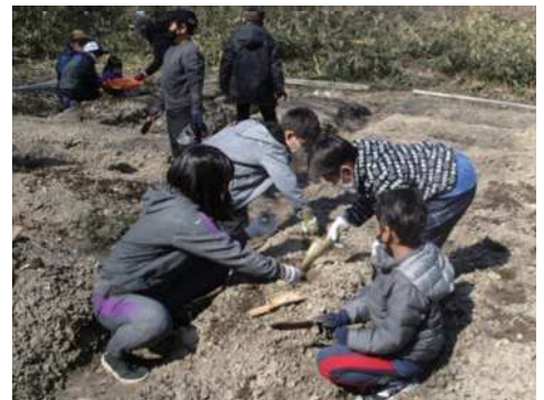
子供達は、皆協力し合いながら楽しそうです!