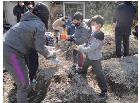
植え方は大人の人に教えてもらいます。

今年度、最後のイベント「第5回 ファミリーメイト イモっ子冬」がたくさん参加者とともに、行われました。土に触れる感触を楽しみながら、子供達は、ジャガイモの種芋を植えてくれました。数ヶ月後には、収穫をして、掘り立てのジャガイモを、頂く予定です。成長の様子は、順次お知らせします。午後からは、毎回好評の手作りのバウムクーヘンを作りました。(左下の写真)