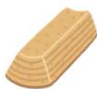
このページの写真は全て小林が担当しました。