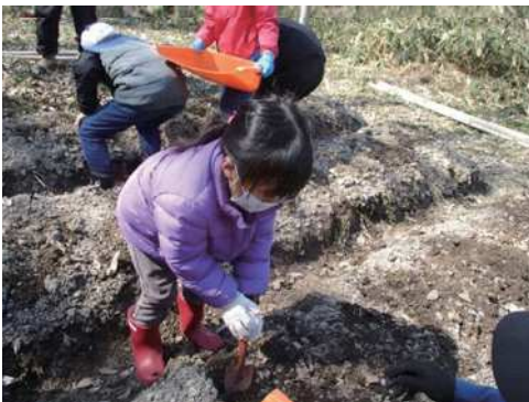
スコップで穴を掘り丁寧に植えます