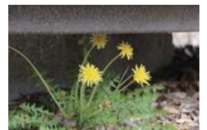
ベンチ下に咲くタンポポ

子供会員は、ヒマワリや畑を耕して大根やオクラ、枝豆の種を蒔いていました。鍬を持ち、硬い土を掘り起こし、柔らかくしていました。発芽が楽しみです。