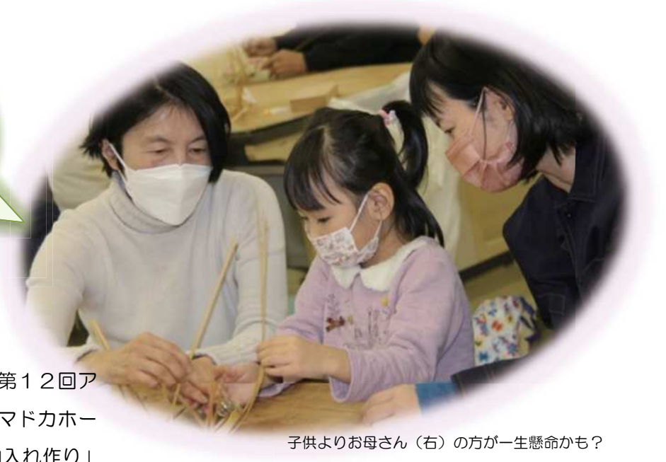
子供よりお母さん(右)の方が一生懸命かも?

岸和田市主催による毎年恒例の「第12回アートマルシェ」が3月6日(日)マドカホールで行われ、「竹ひごで簡単な小物入れ作り」をテーマとして、「夢の森づくり隊」・竹かご教室(メンバー8人)が参加しました。