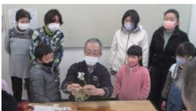
最初H氏が実際に編み見てもらいます