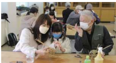
お孫さんと一緒に作るM氏