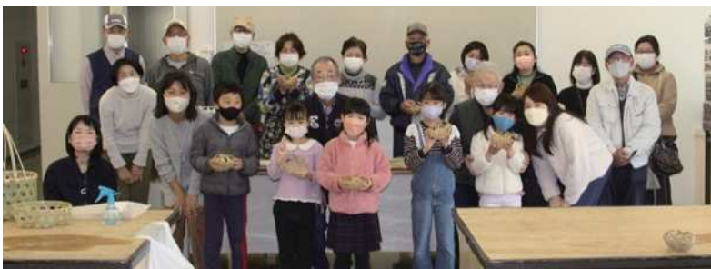
完成した「四海波花籠」を手に記念写真です。参加者10名と父兄の皆さんです

岸和田市主催による毎年恒例の「第12回アートマルシェ」が3月6日(日)マドカホールで行われ、「竹ひごで簡単な小物入れ作り」をテーマとして、「夢の森づくり隊」・竹かご教室(メンバー8人)が参加しました。